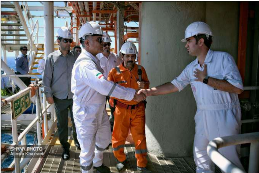
SHANA PHOTO Alireza Khazrael