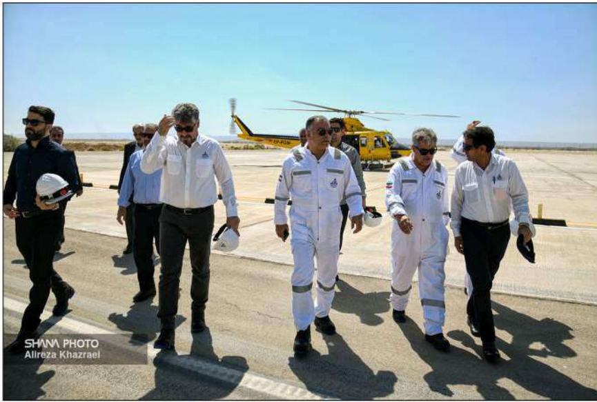
SHANA PHOTO Alireza Khazrael