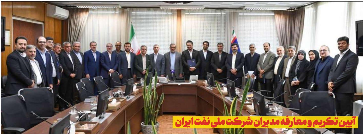
www.naftonline.ir پایگاه خبری نفت آنلاین @naftonline